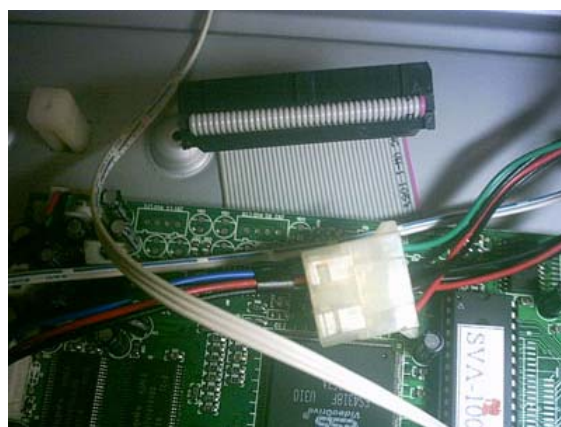
Cabo de Dados Padrão IDE e cabo de força.

Ele funciona no padrão IDE, utilizando cabo de dados e força idênticos ao utilizados nos leitores de DVD de computador e HD's.